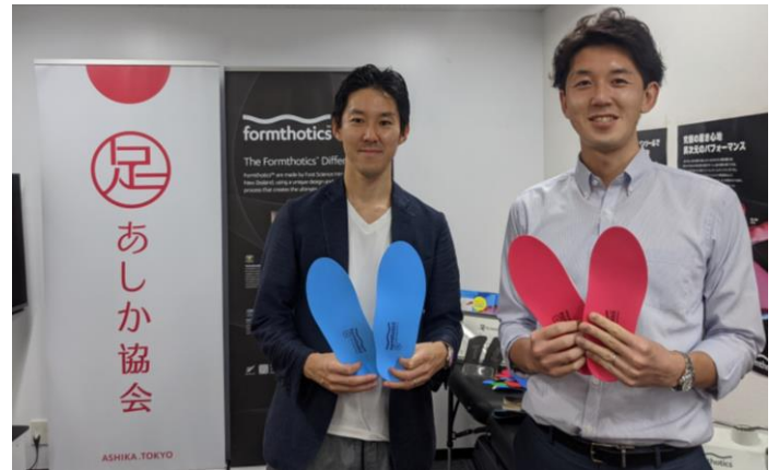
お忙しい中、ありがとうございました!