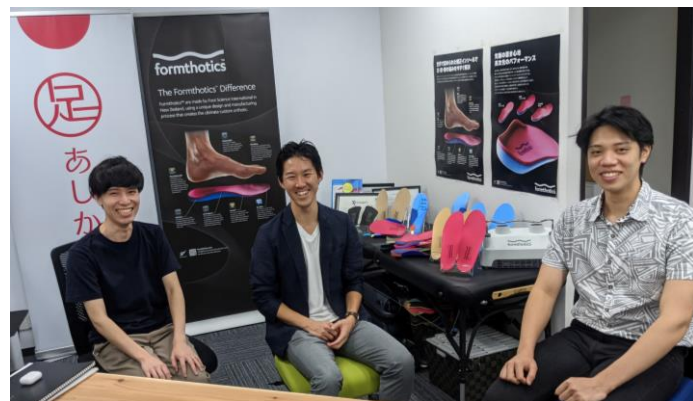
今はたくさんの素晴らしい社員の方たちと一緒に働いていらっやいます

木:そうそう。1か月くらい寝泊まりしてやっていたね。フリーターだったからこそ時間もあつたし、ボランティア活動もしていて、そこで、たくさんの出会いもあって、その一人と一緒に2014年の28歳のときに、株式会社オーソティックスジャパンを作ったんだよ。